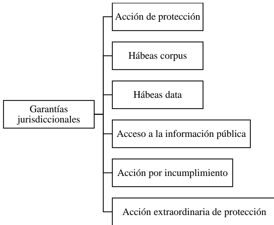
Ilustración No. 2.- Clasificación de las garantías jurisdiccionales Fuente: Constitución del Ecuador Elaborado por: Autoría propia

integral de los daños causados por la violación de uno o varios de ellos. Así, las garantías jurisdiccionales deberían ser una herramienta fundamental para la vigencia del Estado Constitucional de Derechos y Justicia. Cuando ocurre una desnaturalización de las garantías, como sucedió en el presente caso, el objetivo fundamental para el que estas fueron creadas se ve frustrado. Para que puedan cumplir su propósito, las garantías se configuraron constitucionalmente como mecanismos que otorgan facultades amplias a los jueces y juezas para tutelar adecuadamente los derechos en cada caso concreto. (Sentencia No. 2231-22-JP/23, 2023, pág. 23)