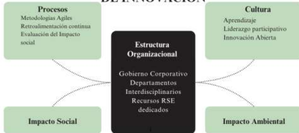
DIAGRAMA CONCEPTUAL DE INNOVACION