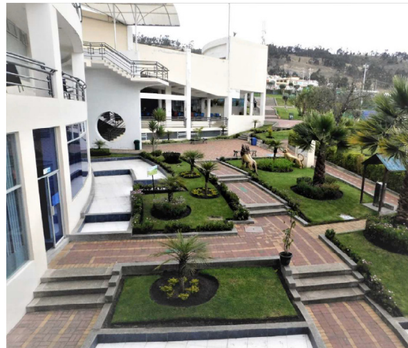
Nota: Estudiantes Unidad Educativa Bilingüe Indoamérica.