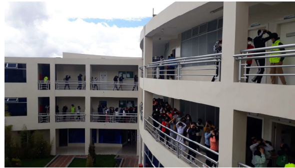
Nota: Estudiantes Unidad Educativa Bilingüe Indoamérica.