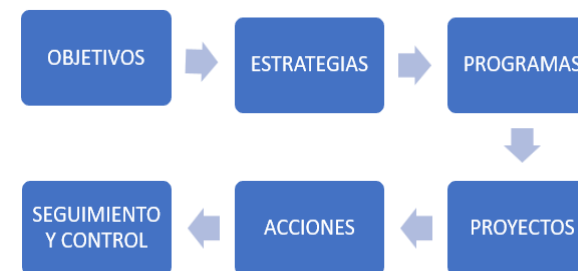
Figura 9 Estructura de la propuesta del plan de sensibilización.

El procedimiento del Plan de sensibilización incluye principalmente objetivos, estrategias, programas, proyectos y acciones, lo cual tiene como propósito que el desarrollo de este plan ayude de manera directa a fomentar y mejorar la enseñanza y el aprendizaje de los estudiantes que son parte de la Unidad Educativa Bilingüe