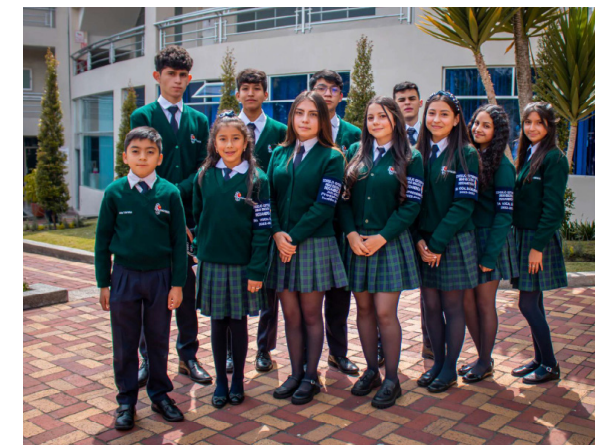
Figura 6 Estudiantes de la Unidad Educativa Bilingüe Indoamérica.

Nota: Estudiantes Unidad Educativa Bilingüe Indoamérica.