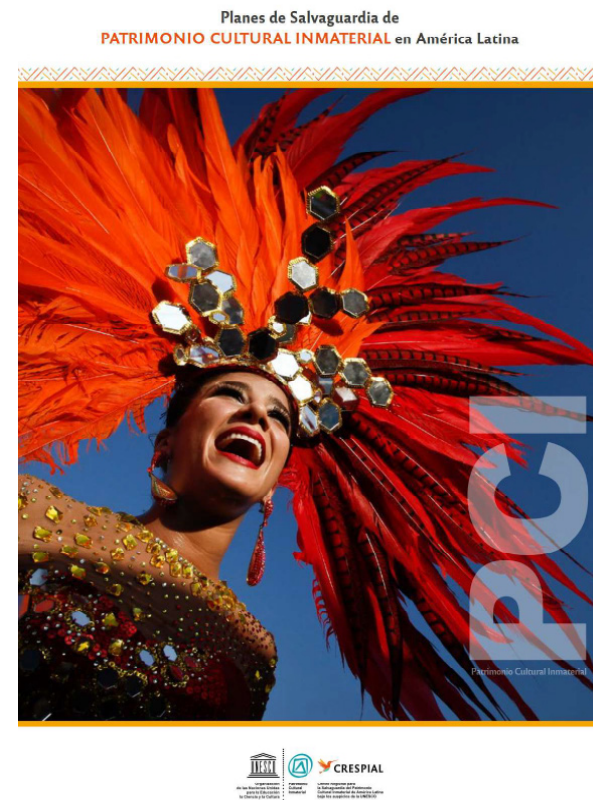
Figura 3 Planes de Salvaguardia de Patrimonio Cultural Inmaterial en América Latina.

todo el país extiende el disfrutar de la pluralidad de actividades culturales que son desarrolladas por diversos grupos, donde dan a conocer la riqueza cultural, que es el beneficio del patrimonio