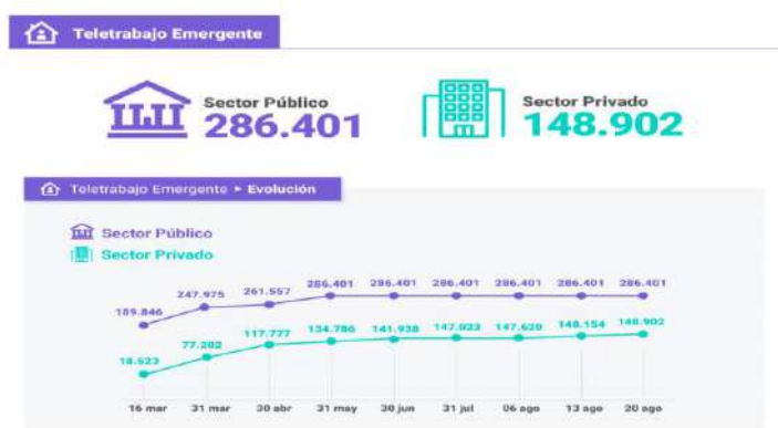
Figura 1: Estadísticas del Teletrabajo año 2020

En caso del teletrabajo se toma en consideración las siguientes estadísticas del año 2020, cosa que analizan y se demuestra que el teletrabajo fue una de las mejores adaptaciones en tiempos difíciles, para evitar que se frene la productividad de las empresas tanto del sector público como del sector privado. Tal y como se observa en la Figura 1, podemos encontrar las estadísticas del teletrabajo en el año 2020