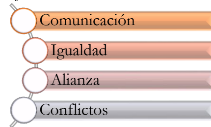
Figura 4. Orden de códigos empleados en la argumentación del objetivo 3 del trabajo de titulación “Significados, Afectos y Relaciones en entornos virtuales en estudiantes universitarios de la ciudad de Ambato”.

Codificación empleada en la argumentación del objetivo 3.