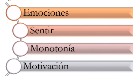
Figura 3. Orden de códigos empleados en la argumentación del objetivo 2 del trabajo de titulación “Significados, Afectos y Relaciones en entornos virtuales en estudiantes universitarios de la ciudad de Ambato” .

Codificación empleada en la argumentación del objetivo 2.