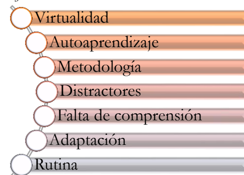
Figura 2. Orden de códigos empleados en la argumentación del objetivo 1 del trabajo de titulación “Significados, Afectos y Relaciones en entornos virtuales en estudiantes universitarios de la ciudad de Ambato”.

Codificación empleada en la argumentación del objetivo 1.