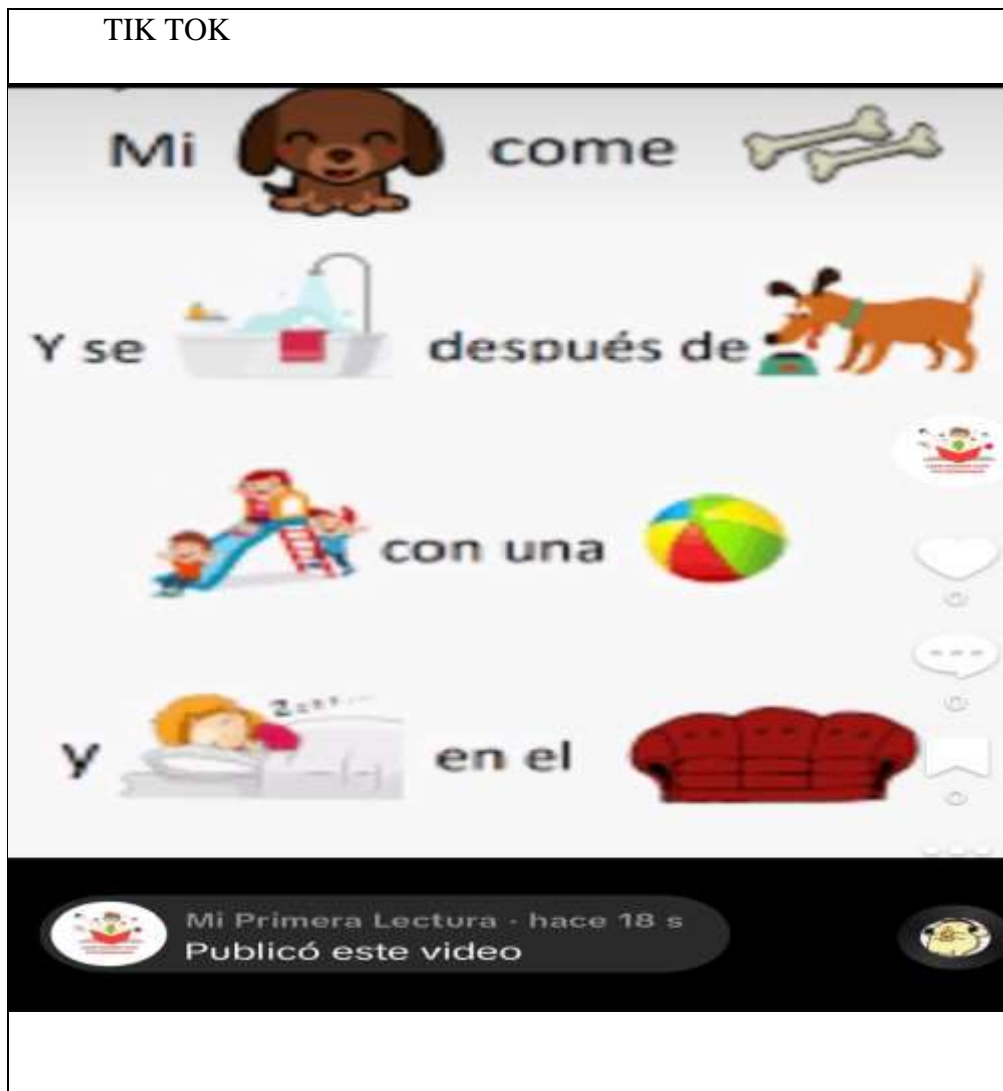
Figura 3. Actividades realizadas por los docentes con el uso de la plataforma digital Tik Tok.

Actividades realizadas por los docentes con el uso de la plataforma digital Tik Tok.