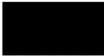
Nombre y firma del del participante entrevistado/a