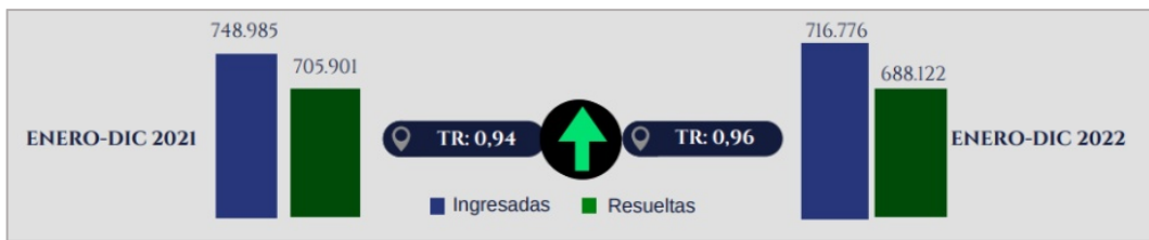
Gráfico 1. Tabla resumen – comparativo anual 2021-2022 – Tasa de Resolución

de las Unidades Judiciales (Dirección Nacional de Estudios Jurimétricos y Estadística, 2022).