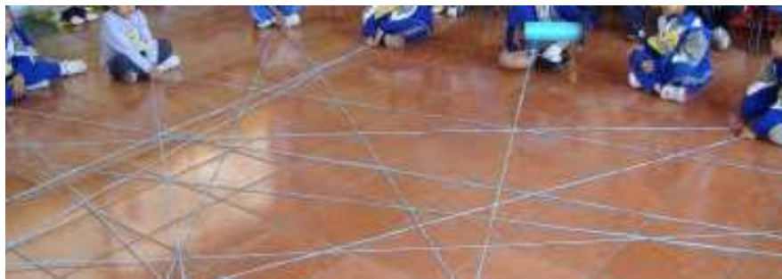
Figura 3. Desarrollo del juego del ovillo