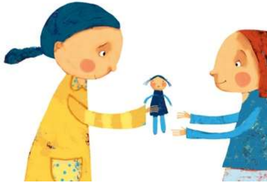
Figura 2. Ejemplo de un dibujo sobre honestidad