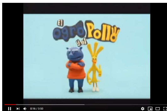
Figura 4. Imagen del video el oro y el pollo Desarrollo del juego del ovillo