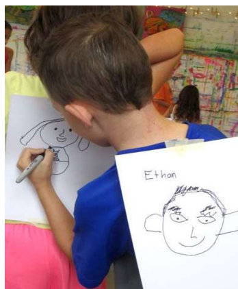
Figura 7. Imagen similar a la actividad didáctica “Afuera etiquetas”

A cada niño o niña el profesor le coloca un cartel en la espalda. La mitad de clase tendrá etiquetas (carteles) con mensajes positivos, la otra mitad con negativos; los niños y niñas a continuación deberán caminar por la clase y conversar con cada compañero según el mensaje escrito en su cartel. (V. fig.7).