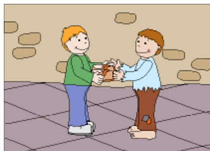
Figura 5. Ejemplo de una lámina sobre generosidad